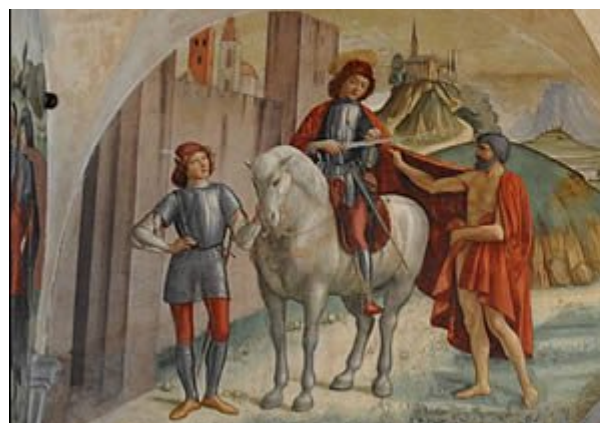
Fresque de l'Oratorio dei Buonomini di San Martino Florence

Saint Martin de Tours est connu chez les orthodoxes sous le nom de Martin le Miséricordieux. Il est un des saints protecteurs de la France. Beaucoup d'églises et de lieux portent son nom. La moitié de sa cape – capella en latin – fut envoyée à Aix-la-Chapelle pour l'oratoire de Charlemagne qui prendra ainsi le nom de Chapelle.